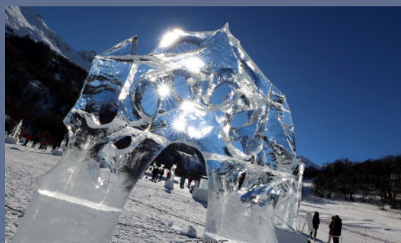
"Forme de labyrinthe" - TKACHIVSKYI - 2024