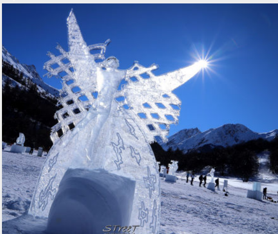
"Born to soar" - MOLOKOV - 2024

Comment cette sculpture peut tenir ? Combien de temps la sculpture va rester ? Mais l'artiste tient bon jusqu'à la fin du Concours et son œuvre éphémère donne l'illusion d'éternité.