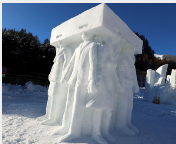
"In the box" - POVILIONIS PETRAUSKAS POVILIONIENE - 2024

À l'heure où nous écrivons ces lignes, les futurs sculpteurs participants sont en cours de sélection. La décision finale interviendra courant novembre lors de la Commission de Sélection.