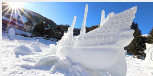
"L'odyssée Du Black Tears Of The Sea" - MAGNAN CROCHEMORE - 2024

Le savoir-faire en la matière est unique , chaque bloc de neige est façonné, compacté par un coffrage, en amont du Concours.