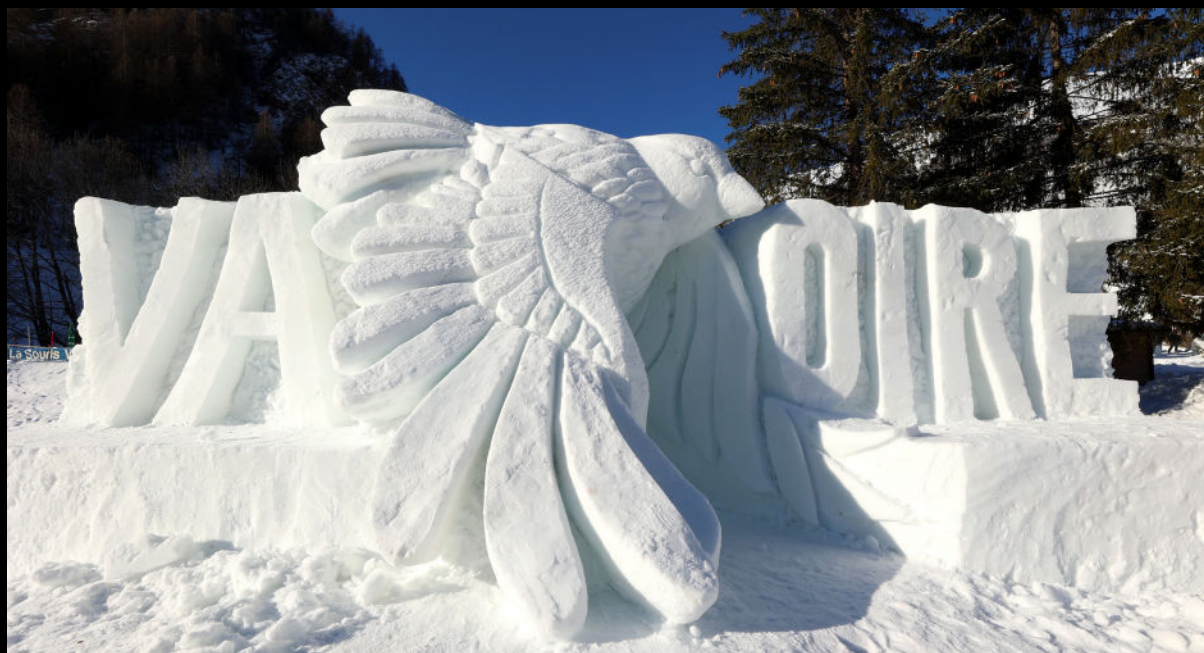
"Give your thoughts wings" - RODERS - 2023

Remise des prix du Concours à 17h30 avant un éclatant feu d'artifice.