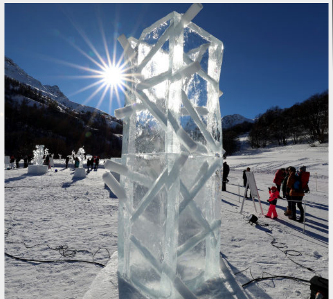
"Paths" - PERRON - 2024

En attendant le coup d'envoi du Concours le mardi matin 9h00, chaque sculpteur dispose de 5 blocs de glace de 1m x 0,50m x 0,25m, posés sur un socle de neige de 0,70 m de haut et 1 m de large.