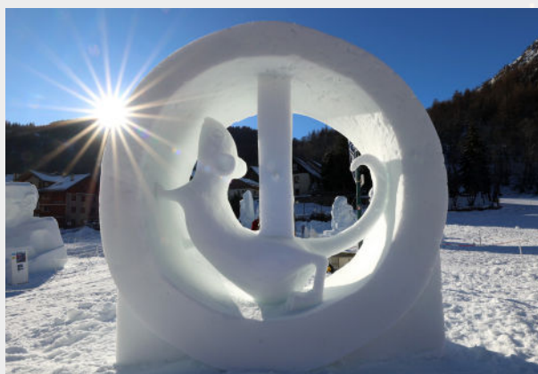
"Toujours En Avant !" - LASTOVICKA HASTRUP - 2024